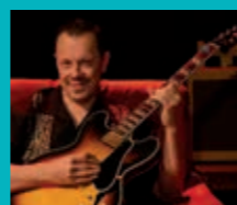
Vendredi 9 août Chris & the feeling family Roc