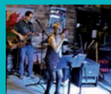
Vendredi 16 août Magic rock Rock