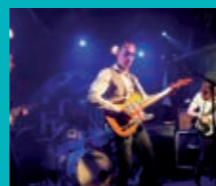
Vendredi 23 août 2024 Southside inc. Rock