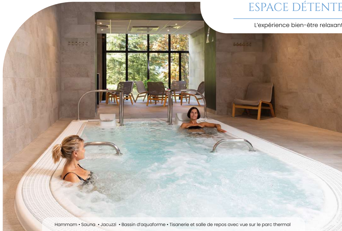
Hamam • Sauna • Jacuzzi • Bassin d'aquoforme • Tisanerie et salle de repos avec vue sur le parc thermal