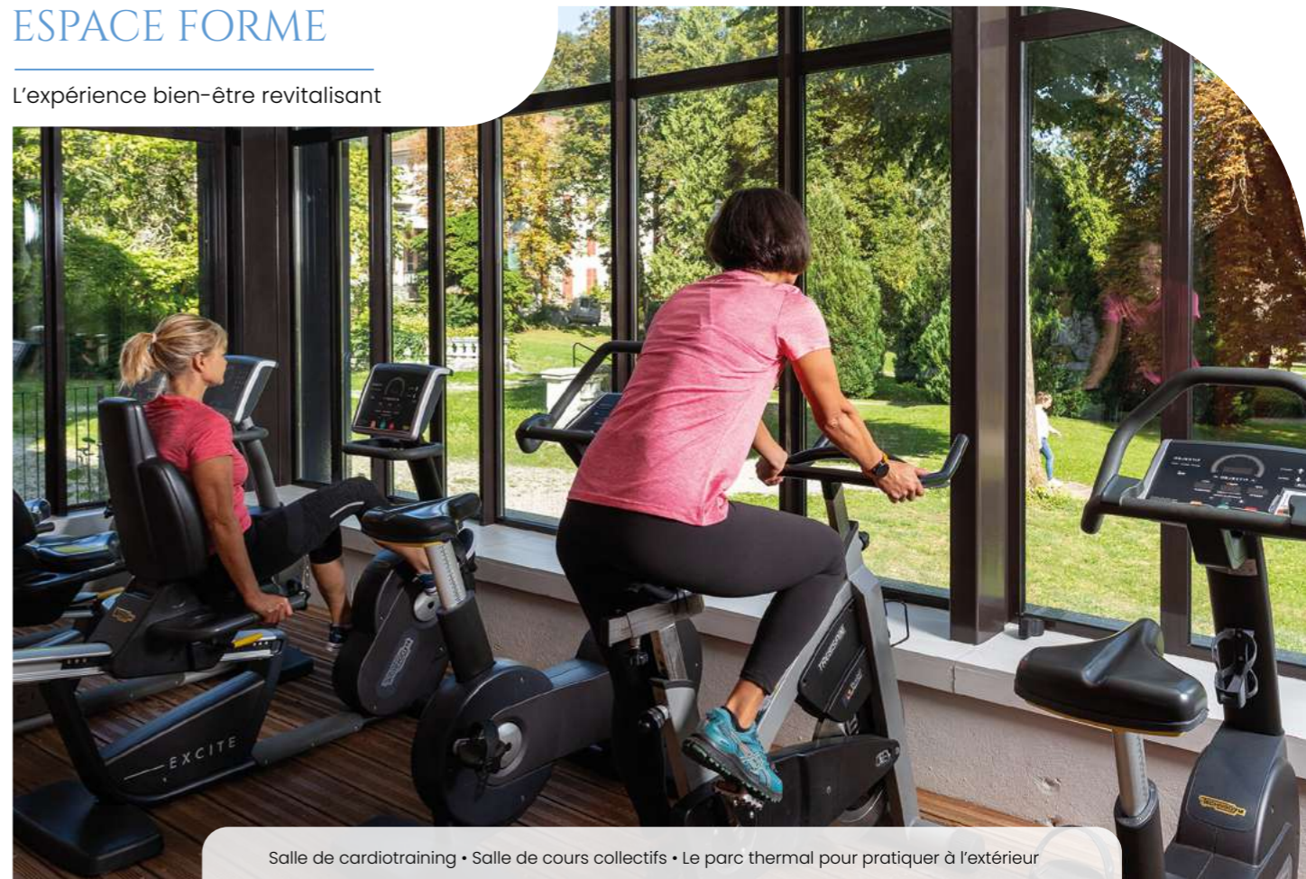
Salle de cardiotraining • Salle de cours collectifs • Le parc thermal pour pratiquer à l'extérieur